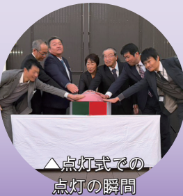
△点灯式での点灯の瞬間