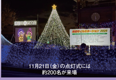
11月21日(金)の点灯式には約200名が来場