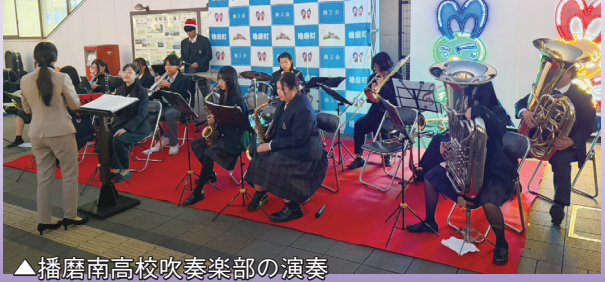
▲播磨南高校吹奏楽部の演奏

商工会と町内金融機関が連携し多数企業の協賛のもと、地域の賑わい創出を目的に、今年もJR土山駅前イルミネーションを実施しています。商工活性化委員会と青年部が中心となって制作した今年のテーマは「シン・ハリマ」。可能性や希望に満ちた町にとの想いと期待が込められています。冬の風物詩として定着してきた本事業も今年で12回目を迎え、約4.5万球のLED照明が駅前を彩ります。