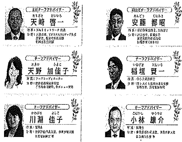
▲チラシ裏面のイメージ

★ポスターのデザインは、チラシの表面と裏面（顔写真除く）を組み合わせたものの予定をしております。