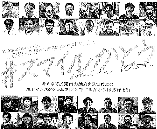
▲チラシ表面のイメージ